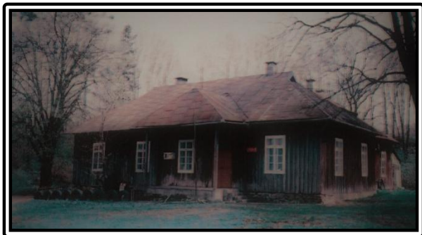
Dwór Morawskich w Odrzechowej

Rodzina Morawskich pochodziła z Moraw Wielkich, z północnej części Mazowsza.