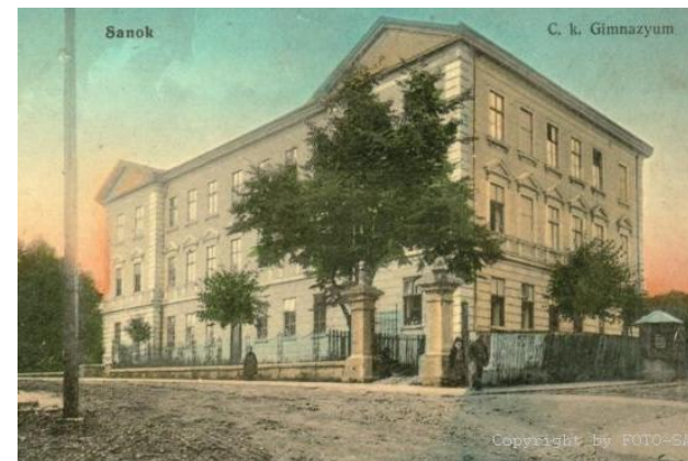
Gimnazjum Męskie w Sanoku