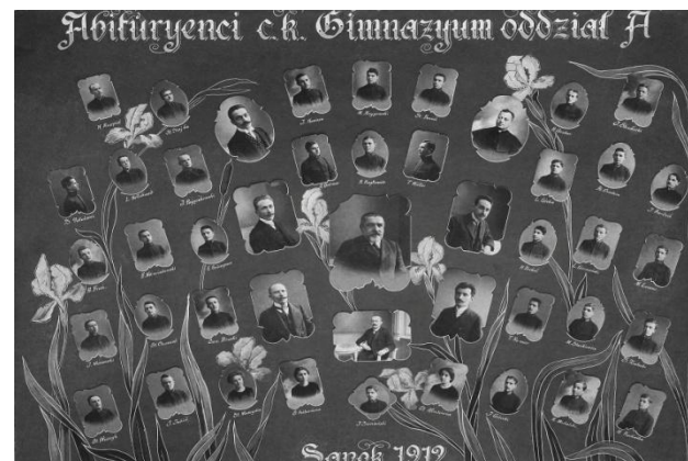
Abiturienti rocznik 1912

Projekt zrealizowany w ramach XXV SESJI SEJMU DZIECI I MŁODZIEŻY